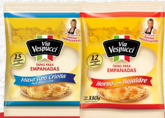
TAPAS PARA EMPANADAS VÍA VESPUCCI Variedad x 300 gr | x kg: $ 3.333,30