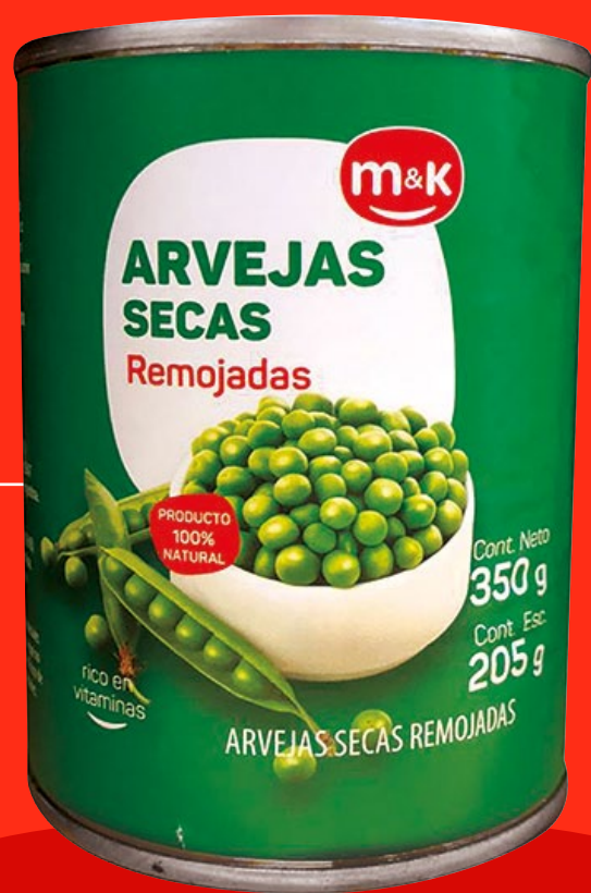
ARVEJAS M&K x 300 gr x kg: $ 1.042,83 1028300