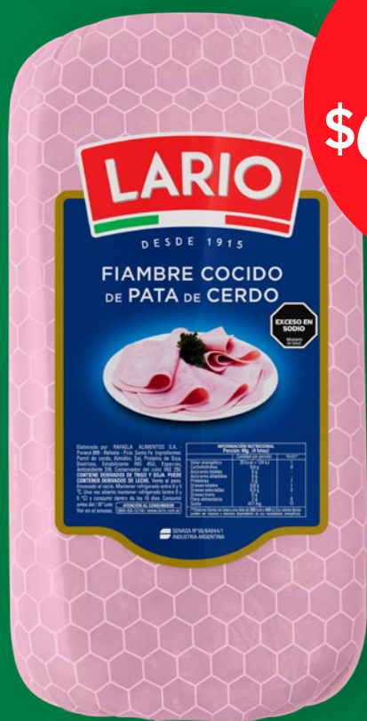
FIAMBRE COCIDO DE CERDO LARIO X KG 460603