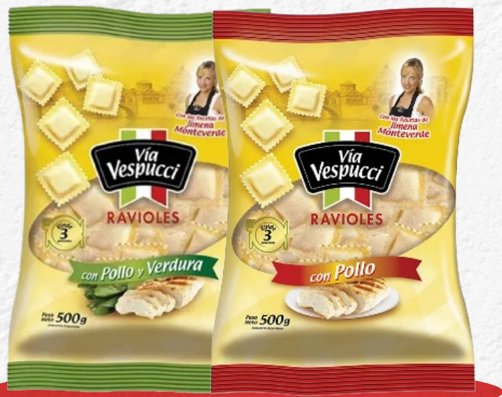
RAVIOLES VÍA VESPUCCI Variedad x 500 gr | x kg: $ 3.099,98