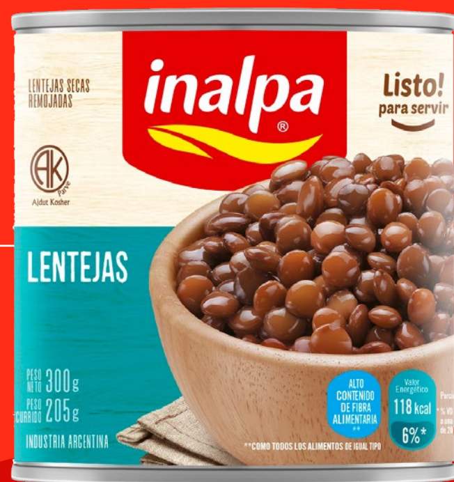
LENTEJAS INALPA x 300 gr x kg: $ 000 1028573