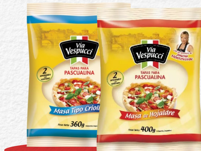
TAPAS PARA PASCUALINA VÍA VESPUCCI Variedad x 2 u | x kg: $ 3.374,98