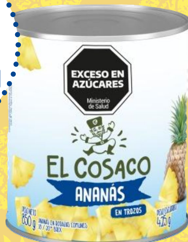
ANANÁ EL COSACO en trozos x 850 gr 1787149