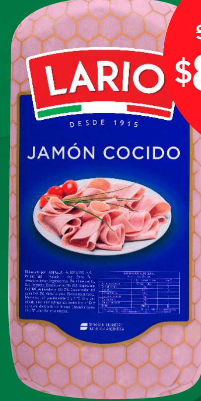
JAMÓN COCIDO LARIO X KG 460603