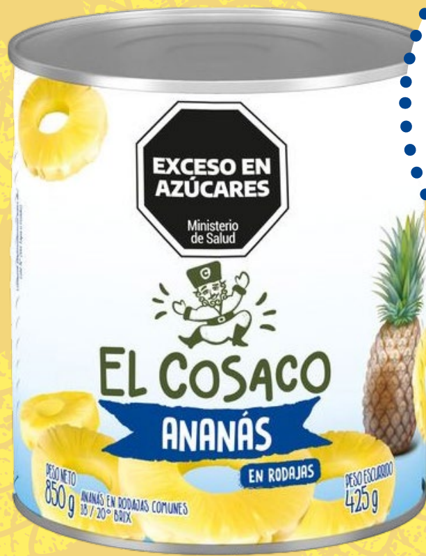
ANANÁ EL COSACO en rodajas x 850 gr 1782794