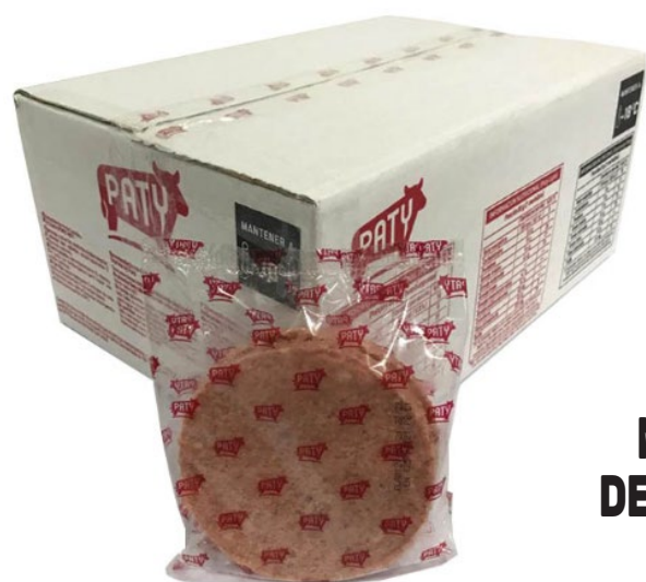
MEDALLONES DE CARNE PATY x 60 u x kg: $ 8693,75