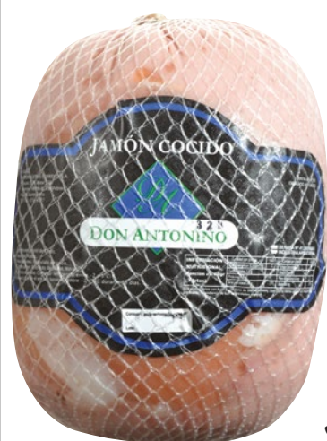
JAMÓN COCIDO DON ANTONINO x kg