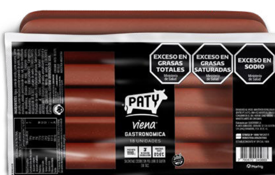
SALCHICHAS PATY VIENA Gastronómica • x 18 u x u: $ 86666,56