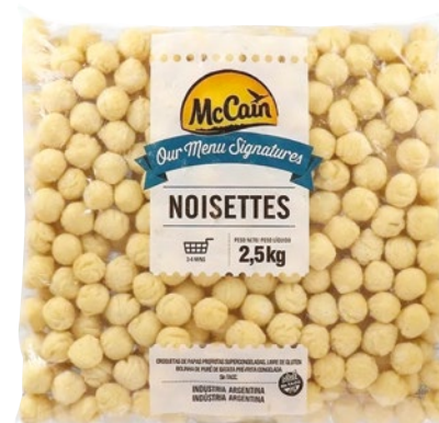
PAPAS MC CAIN Noisettes • x 2,5 kg x kg: $ 6198,00