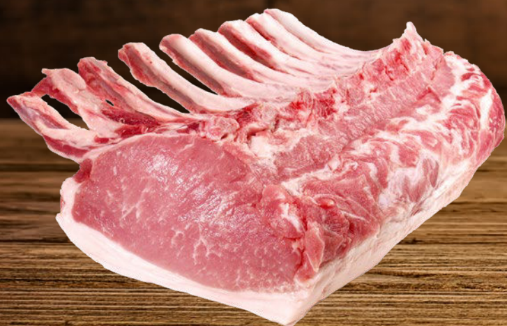
CARRE DE CERDO CON HUESO