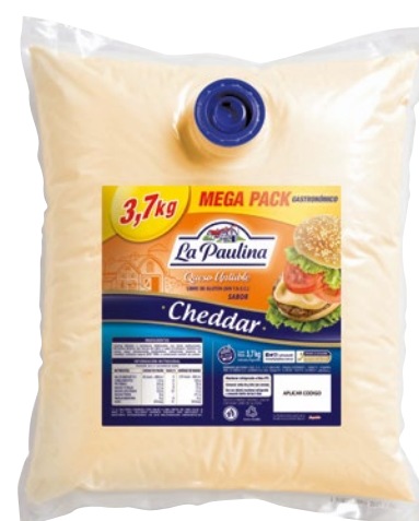
QUESO CHEDDAR LA PAULINA Pouch • x 3,7 kg x kg: $ 7837,84