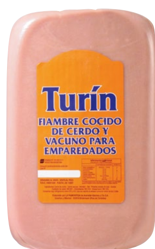
FIAMBRE COCIDO TURÍN x kg