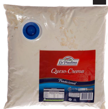
QUESO CREMA LA PAULINA Pouch • x 4 kg x kg: $ 6000,00