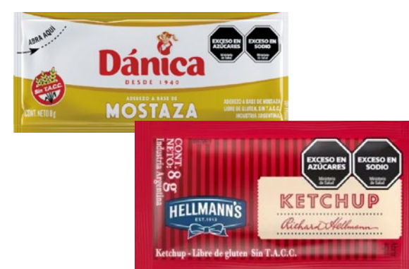
KETCHUP HELLMANN'S/ MOSTAZA DÁNICA 196 / 192 u x 8 gr x kg: $ 5208,33

LOS PRECIOS EXPRESADOS SON FINALES, YA INCLUYEN I.V.A.