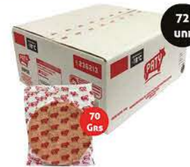
Medallón Express By Paty Caja x 72 Unid x kg: $12.077,09