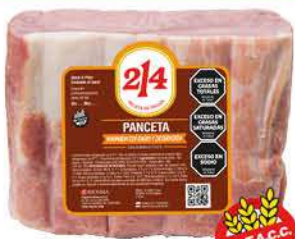
Panceta Tiernizada Riosma x kg: $12.499,00