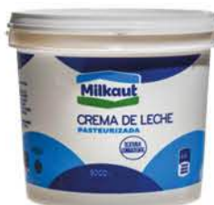
Crema De Leche Milkaut x 5 Lt