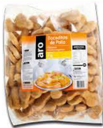
Bocados De Pollo Aro x 2Kg x kg: $8.999,50