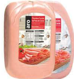
Fiambre Cocido Aro Pata Cerdo x kg: $8.899,00