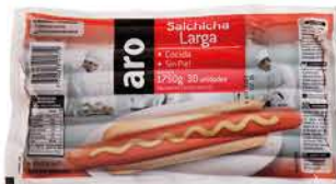
Salchicha Larga Aro x 30 Un x kg: $7.713,71