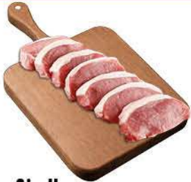
Carre Sin Hueso Congelado x Kg