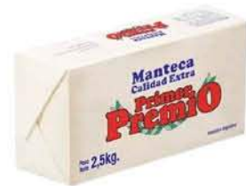
Manteca Primer Premio x 2.5 Kg x kg: $11.199,60