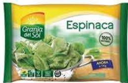
Espinaca Granja Del Sol x 1Kg x kg: $6.999,00