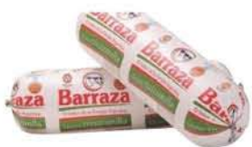
Queso Mozzarella Barraza Cilindro x Kilo x kg: $9.799,00