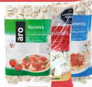
Pastas Aro Variedad 2Kg